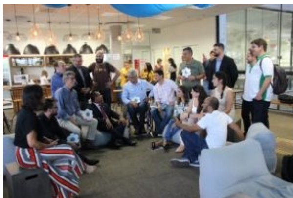
Pontes para Inovação 2018 teve oito finalistas.